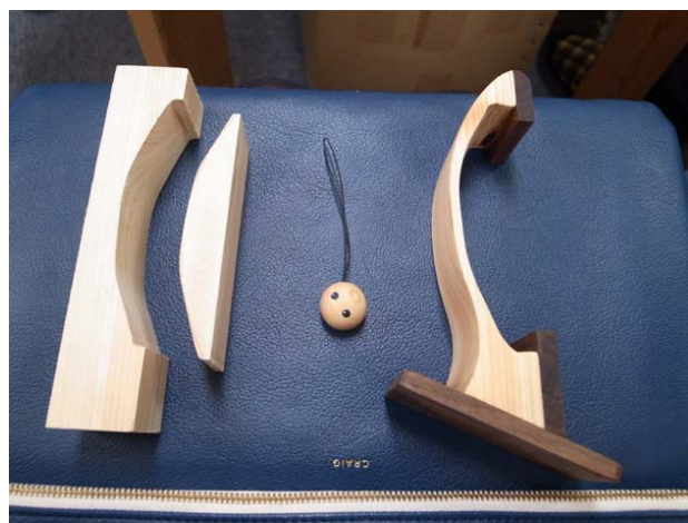
↑ ヒノキを研磨した雑貨類 (左：お針子、右：メモスタンド)