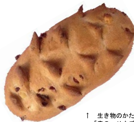
↑ 生き物のかたちをパンにした「森のハリネズミ」