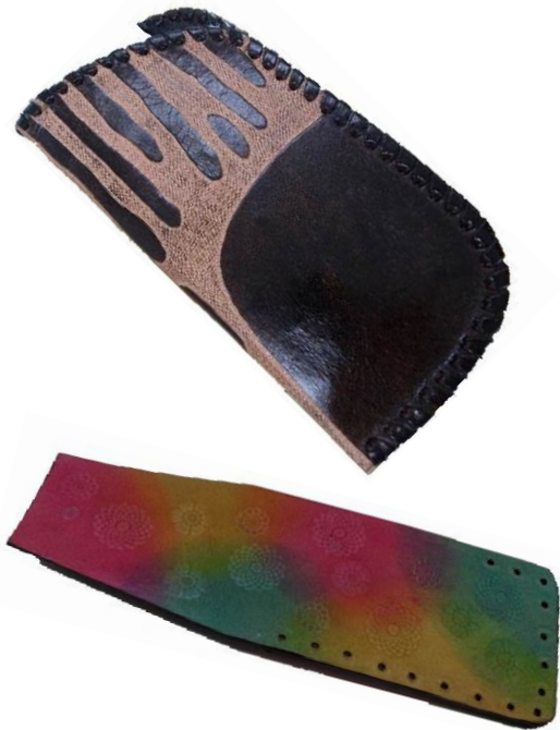
↑ 刻印と染色技術を活かした商品例

鮮やかな染色とアイヌ模様のグラフィックをベースに革小物を製作してきましたが、数ある革のクラフト製品と差別化を図る上で、一歩先をいくアイデアがなかなか得られず悩んでいました。新しい素材の開発によって、形としての製品だけでなく、他の素材と組み合わせた製品の展開といった、可能性を広げるきっかけになればと考えています。