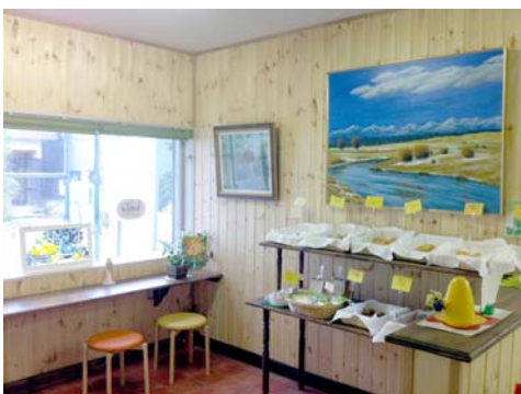
← 現状の店舗外観・内観