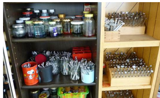
↑ 作業風景と様々な押し型